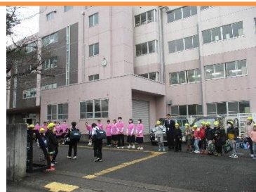
【小中連携愛札(あいさつ)運動】

中学生が、元気に堂々と挨拶する姿を見て、本校の児童も、自分から進んで挨拶し、互いに気持ちよく生活することの大切さを改めて感じたようです。北本中学校の皆さん、ありがとうございました。