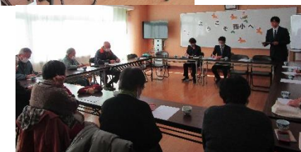
【第2回サポーター会議】